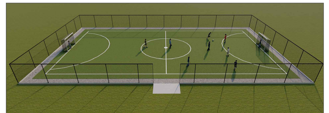
Perspectiva 3D - 03

PREF. MUN. DE MATO CASTELHANO APROVADO 09/12/2025 Patrick Dutra Flores Arquiteto e Urbanista - CAU A280482-4