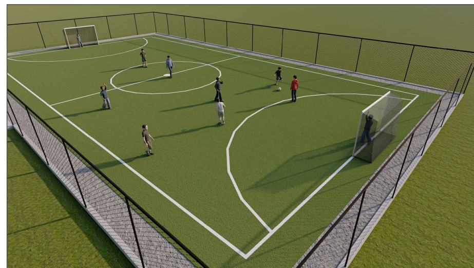
Perspectiva 3D - 04